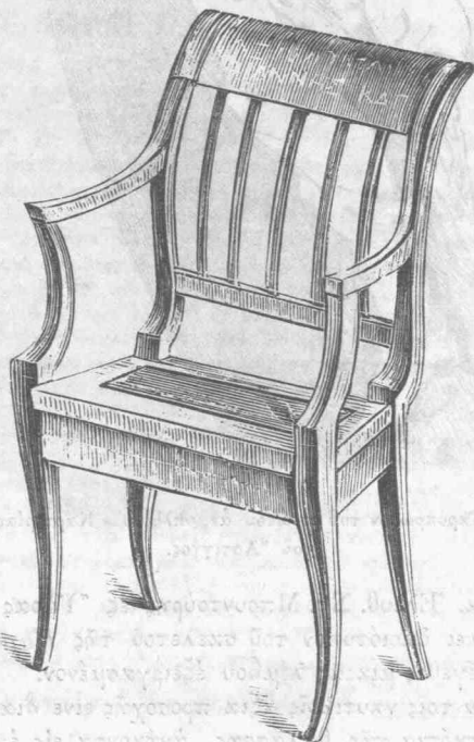
Ἐδρα ἐν ἣ ἐκάθησεν ὁ Καποδίστριας ἀποθιθασθεῖς εἰς Ναύπλιον.

ΠΡΩΤΟΣ ΘΡΟΝΟΣ ΕΠΙ ΤΟΥ ΟΠΟΙΟΥ ΕΚΑΘΗ ΣΕ ΚΑΤΑ ΠΡΩΤΟΝ Ο ΦΘΑΣΑΣ ΕΝ ΝΑΥ ΠΑΙΩ Η Α. Ε. Ο ΚΥΒΕΡΝΗΤΗΣ ΤΗΣ Ε ΛΛΑΔΟΣ Ι. Α. ΚΑΠΟΔΙΣΤΡΙΑΣ ΕΝ ΜΗΝΙ ΙΑΝΝΟΥΑΡΙΩ ΤΗ 8 ΕΝ ΕΤΕΙ 1828 Ε. Π.