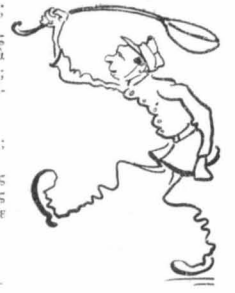
Τοὺς κουνυγούσαμε ἐν τῇν κούτῳ !...

—Μὲ κοροιδεύεις ; —'Ὀχι, στὸ ὀρχίζομαι !... —'Εμένα δὲν μὲ ἔβγαλε κανένα σχολεῖο ἔβλοσχιστί καὶ οὔτε γρομάτια ἔβλα πολλά. Καὶ ὅμως κύτταξε αὐτὸ τὸ κούτσουρο ! Μὲ μιὰ τεσκομαρὶά τὸ πῦρὸν θέρμη ! —'Ὡς ποὺδ' ἀγολεῖο πῆγες ; —'Ὡς τὴ δευτέρα τοῦ Δημοτικῶ.