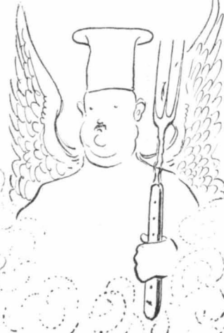
Σὰν Θεοὶ, ποὺ ἀναδύονται ἀπὸ τοὺς μεθυστικοὺς ἀχνούς τῆς χύτρας !...