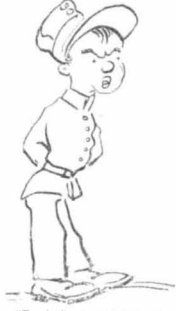
—'Ε, σὺ, στρατιώτῃ !... ἄκουσα μιὰ χοντρή φωνή...

Μόλις διαφρίστικα στην επίταξη και επίηλο του μαγειρού της ημέρας θέσι — ήταν το πρώτο βράπτιομα του πυρός, που, ως στρατιώτης, έλαβα — δεκαπέντε φαντάροι έσπευσαν φιλικώς και εμπιστευτικώς να μου συστήσουν τὰ φαγάκια που προτιμούσαν :