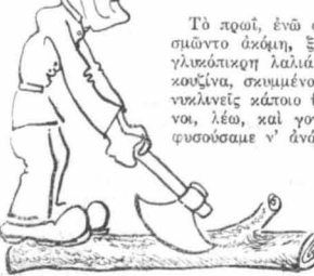
—Κύτταξε αὐτὸ τὸ κούτσουρο... Μὲ μιὰ τεσκομαρὶά τὸ πῦρὸν θέρμη !...

—Ἀταραῖτητο !... Βοῆ, ἄκου τὸ κωθῶν, ρωτᾷει ἂν εἶνε ἀταραῖτητο !... Μ' ἂν δὲν τὰ πλύνεις, πὼς θὰ ἐντερλιχίσῃς αὐριο !... *